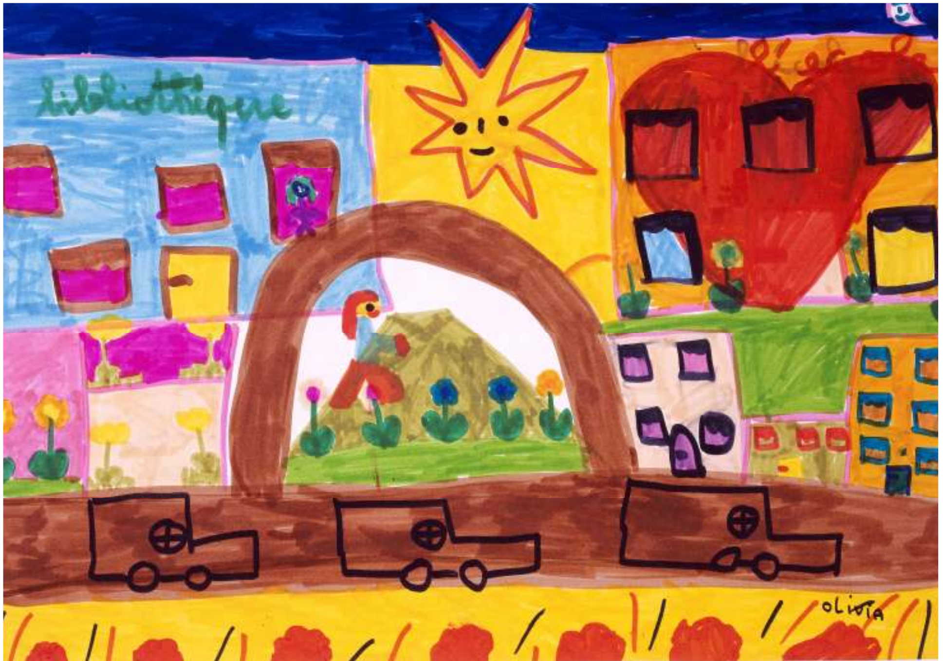
RUE DE L'AVENIR - RENNES -14/3/2013