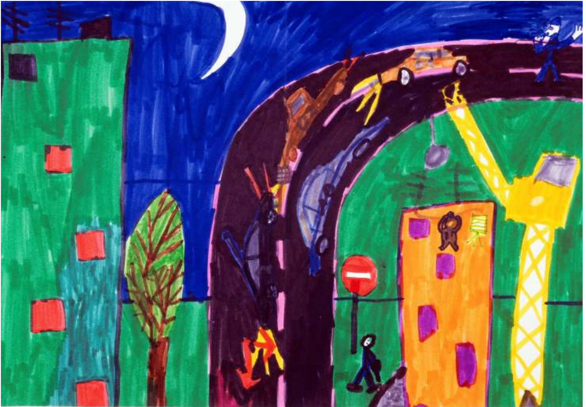
RUE DE L'AVENIR - RENNES - 14/3/2013