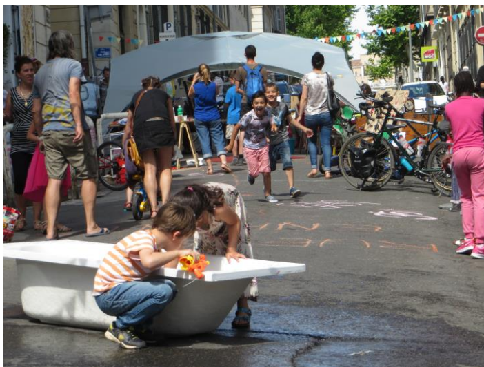
Rue aux enfants Marseille 2016

La place de l'enfant dans la ville européenne a beaucoup évolué dans l'histoire récente. La rue, espace de vie animé et partagé par toutes les catégories de la population, a fait place progressivement à un couloir réservé à la circulation automobile, où le séjour, et donc le jeu, n'a plus sa place. Si on compare les photos d'un même endroit prises vers 1900 et vers 1990, on constate le rétrécissement des trottoirs, la disparition des arbres, des terrasses de café, des promeneurs et des enfants. Le vide est rempli par la voiture.