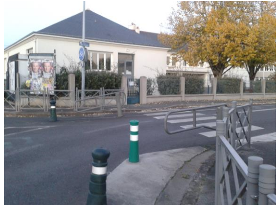
École Jean Moulin, rue des écoles