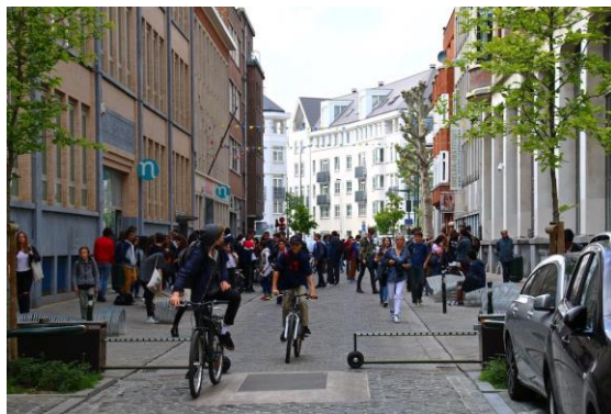
Bruxelles, Photo : Alain Rouiller

Article polininfo.be : La rue scolaire est désormais inscrite dans le code de la route