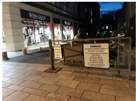
Rue Pourquery de Boisserin