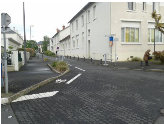
Rue Paul Bert