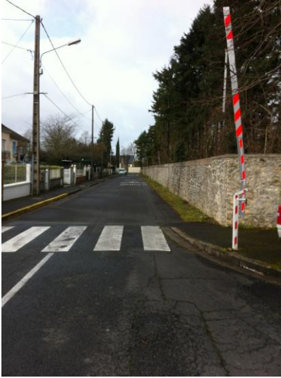
École Chappe, rue Chappe