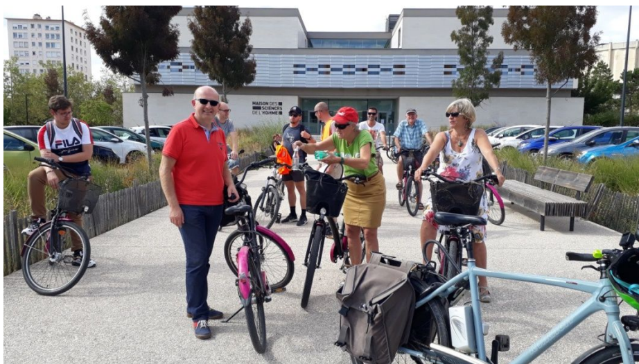
Dijon, 17 septembre : départ de la visite à vélo

Deux journées de travail ont été consacrées à la question des liens entre bien-être et usage des modes actifs, lors de la rencontre de Dijon « A pied à vélo, bien dans ma ville » avec des visites de sites, les présentations de 3 Métropoles, Dijon, Grenoble et Lille, et de l'ONAPS, observatoire de la sédentarité. Une centaine de personnes ont participé à ces journées. Cette rencontre a été organisée en partenariat avec la Maison des Sciences de l'Homme de l'Université de Bourgogne et l'association EVAD, notre correspondant local.