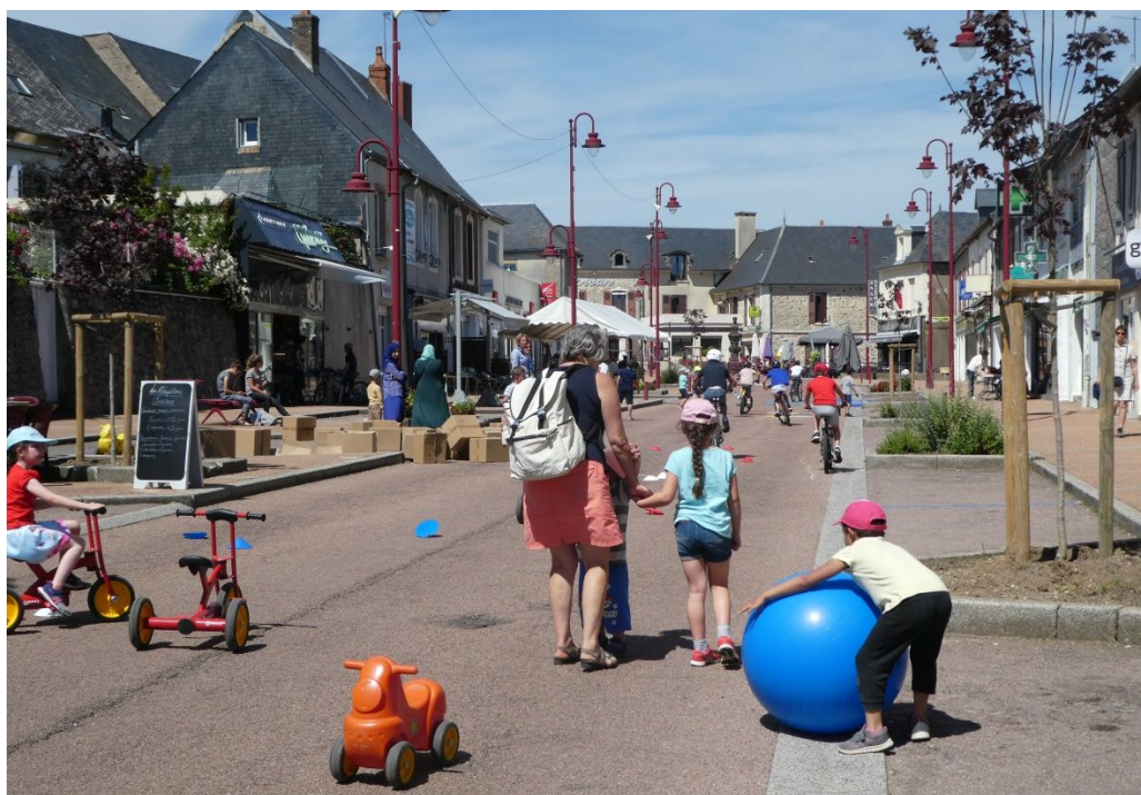
A Château-Chinon, été 1018

De nombreuses réunions, sur place ou à Paris ont eu lieu en 2019, un Forum qui a réuni une centaine de porteurs de projets et des formations destinées aux volontaires sans expérience de l'animation d'événements de rue.