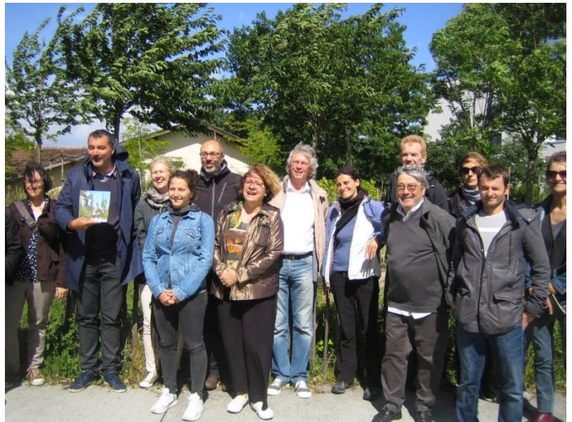
Le réseau « Rues » à Bordeaux et à Bègles – mai 2019

Rue de l'Avenir France entretient des liens étroits avec Rue de l'Avenir Suisse, partage des activités communes, notamment des visites de sites, et participe au réseau francophone « RUES », qui regroupe les Rue de l'Avenir Suisse et France, des associations canadiennes, belges et luxembourgeoises et le CEREMA.