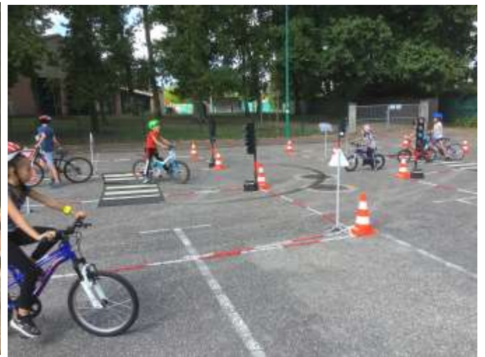
La Rue Aux Enfants

Une belle journée avec environ 300 personnes présentes...un franc succès !!!