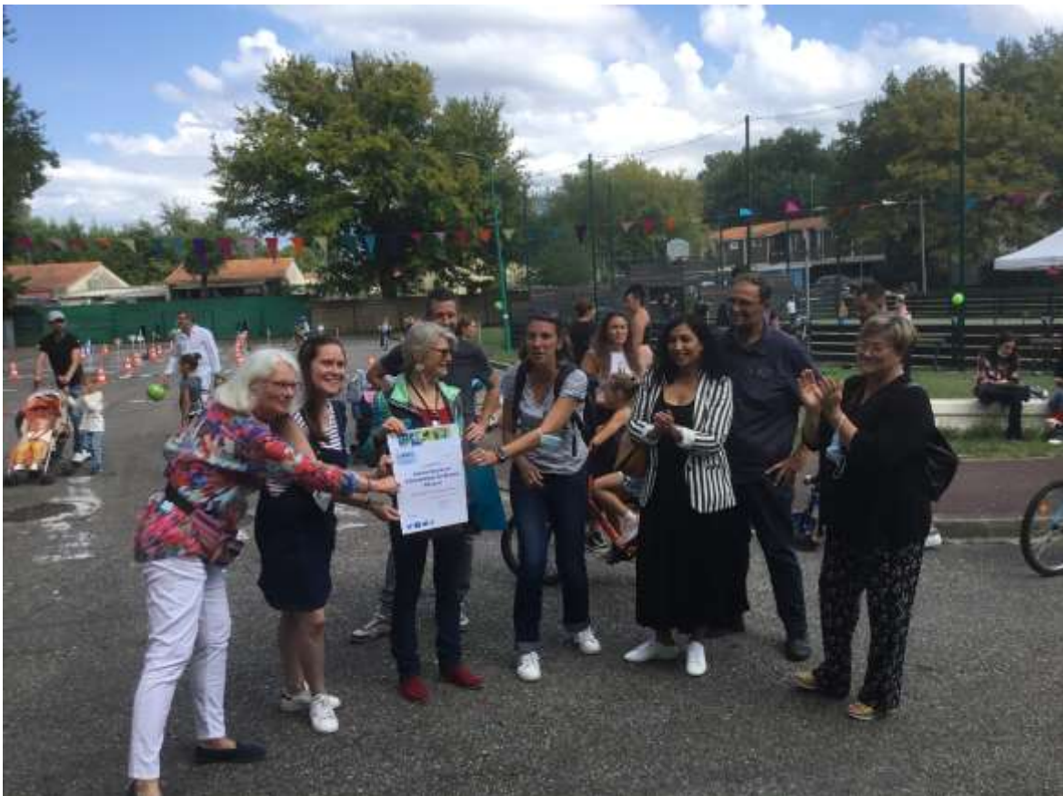
La remise du Label

Une belle journée avec environ 300 personnes présentes...un franc succès !!!