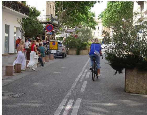
Visite à Avignon – mai 2025

Rue de l'Avenir a également actualisé et réimprimé les documents de la campagne « Ville apaisée, Quartiers à vivre » : le manifeste, les 5 argumentaires, les 3 comptes-rendus des voyages d'études : Rennes/Saint Briec/Vitré, Chartres, Lille/Roubaix/Les Weppes, et la brochure « à pied, à vélo, mieux se comprendre » pour constituer un kit de communication en vue des élections municipales, dont la diffusion s'est faite lors d'événements comme les Rencontres de la marche en ville à Rennes en septembre et via nos correspondants locaux.