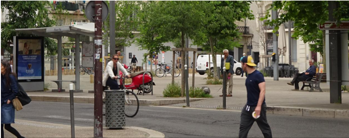
Avignon - mai 2025

Rue de l'avenir est une association loi 1901 qui œuvre depuis 1988, en milieu urbain, à un meilleur partage de l'espace public et une limitation des vitesses, pour favoriser des déplacements sûrs et assurer un développement des modes actifs, marche et vélo, et des transports collectifs.