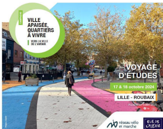
Brochure-compte-rendu des visites de Lille, Roubaix et des Weppes