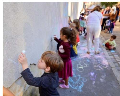
Rue aux Enfants à Indre