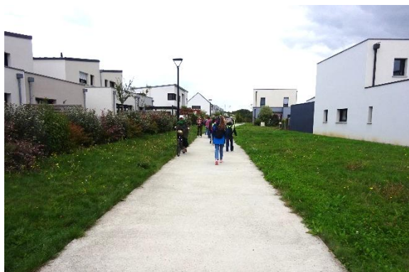
Visite apprenante à Acigné (35)

La variété des personnes présentes a enrichi les différents échanges, tables-rondes et ateliers participatifs, organisés au cours de ces deux journées ainsi que les deux marches exploratoires qui se sont déroulées, l'une à Acigné (35), l'autre dans le quartier de la Courrouze, à Rennes.