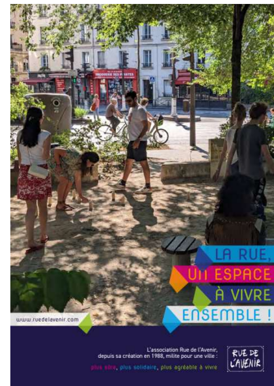
Situations de marche - Saint-Etienne (42)