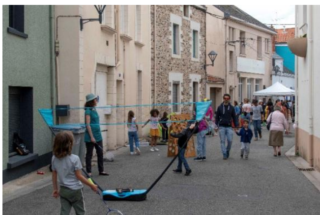
Rue aux Enfants – Indre (44)

Une 50taine de RAE en 2025, des regroupements, et la préparation du bilan des 10ans