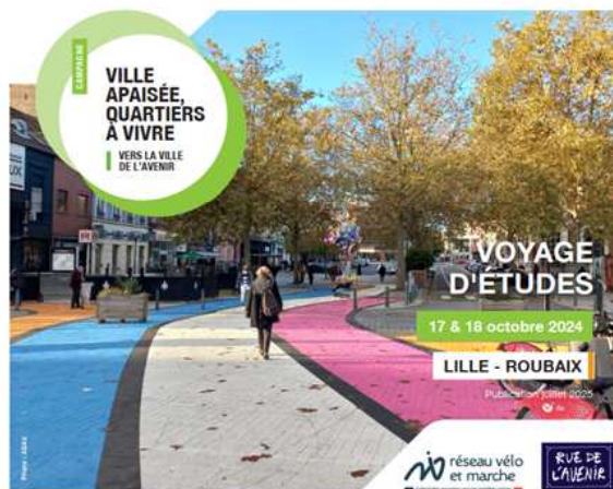
Diffusion du CR visite apprenante Lille Roubaix

CR visite (Lille-Roubaix-Les Weppes) et visite d' Avignon, petits déjeuners Chartres, Roubaix