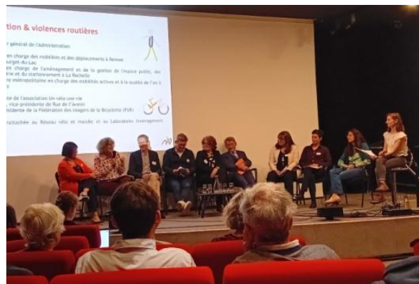
Table-ronde cohabitation et violences routières Réseau vélo et marche avril 2025