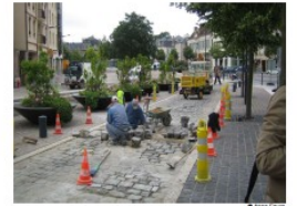
Les enjeux socioéconomiques de la marche Anne Faivre, Frédéric Héran - Rue de l'Avenir - décembre 2025

Elle contribuera également à l'élaboration d'une nouvelle proposition de plan d'actions sur la Marche , avec le collectif Place aux Piétons.