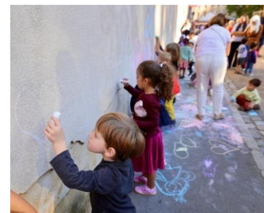
Rue aux enfants – Metz (57)